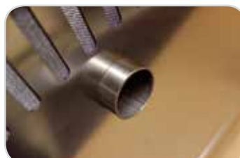
Větrací komínek pro odvětrání pracovního prostoru pece