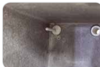
Termočlánek a větrací komínek v komoře pece