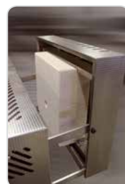
Izolace dveří pece s průzorem pro kontrolu vsázky